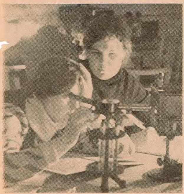
Практычныя заняткі па оптыцы у студэнтаў ІІ курса хімічнага факультэта.